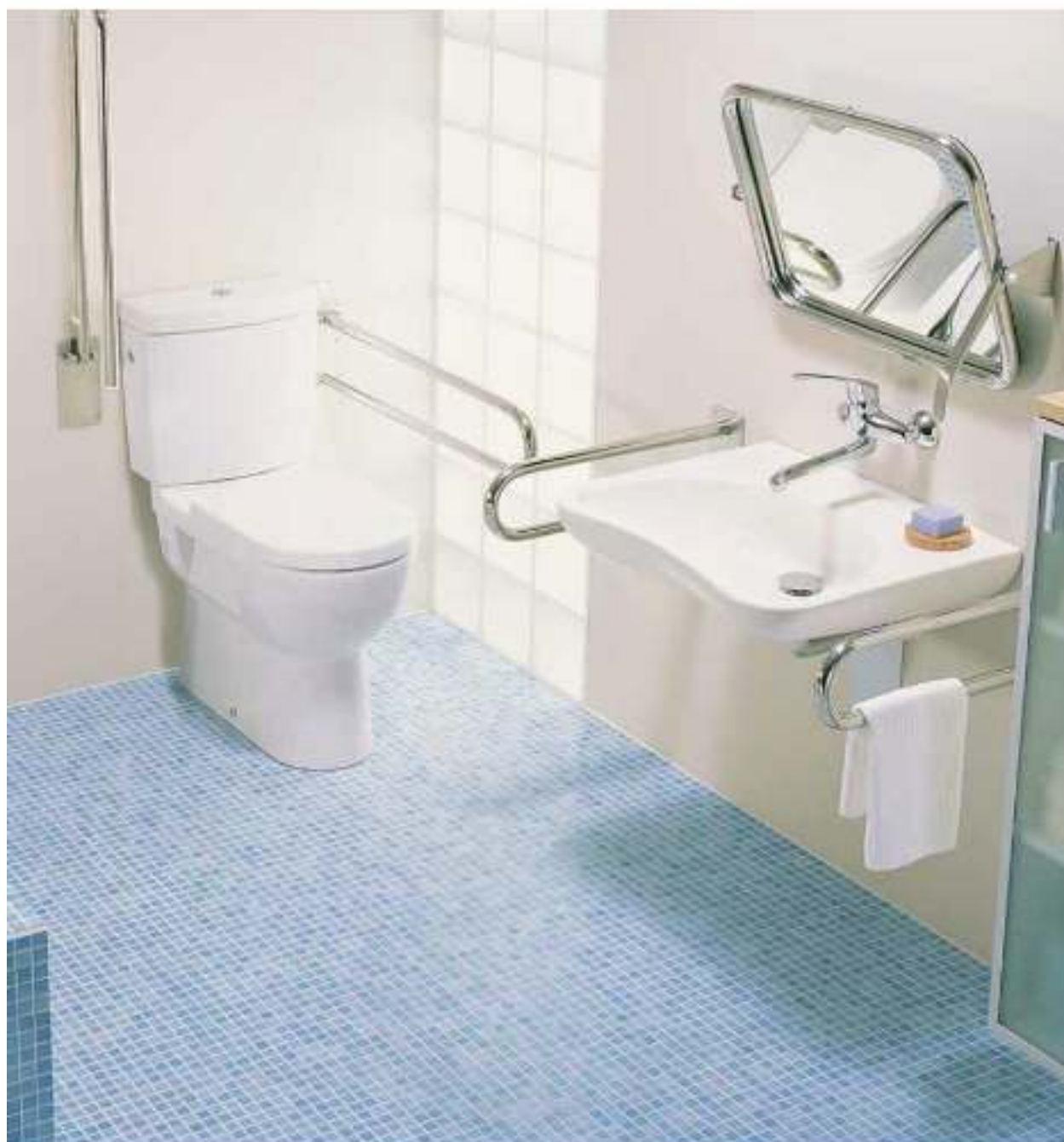
Серия аксессуаров для ванной комнаты без барьеров MIO P50M.