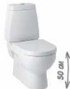
Унитаз Scandic с бачком, высокий