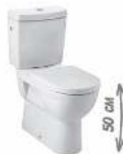
Унитаз МЮ с бачком, высокий