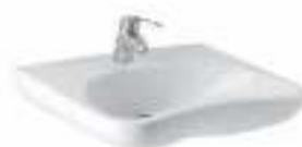
Медицинская раковина МЮ